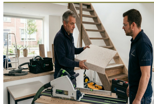
Erkende Omnistair dealers — vakkundige plaatsing