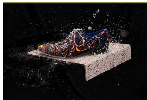
Vochtbestendig & antislip — ook buiten toepasbaar