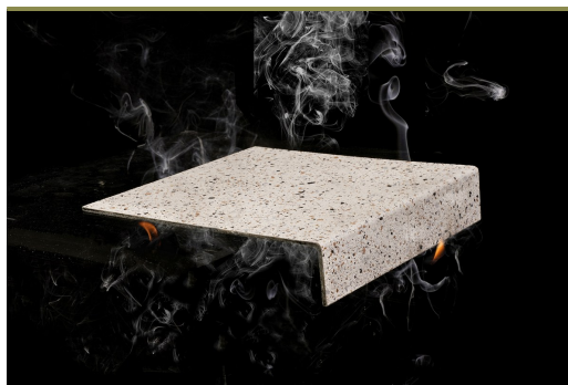
Brandvertragend — gecertificeerd Bfl-s1